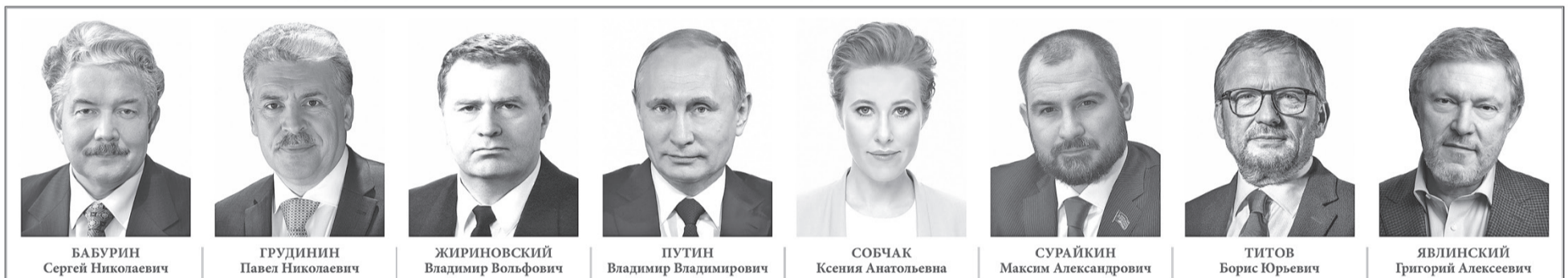
БАБУРИН Сергей Николаевич