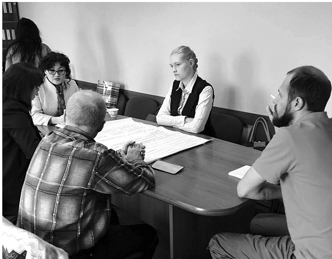
Заседание рабочей группы по проекту «Сарайское кольцо» с участием жителей Ольхона в Хужирской администрации

За время работы Центра в рамках конкурса мини-грантов «Мой Ольхон» профинансировано три проекта на сумму 57 тыс. рублей. Проект по «Орлиным местам Ольхона» получил финансовую поддержку в