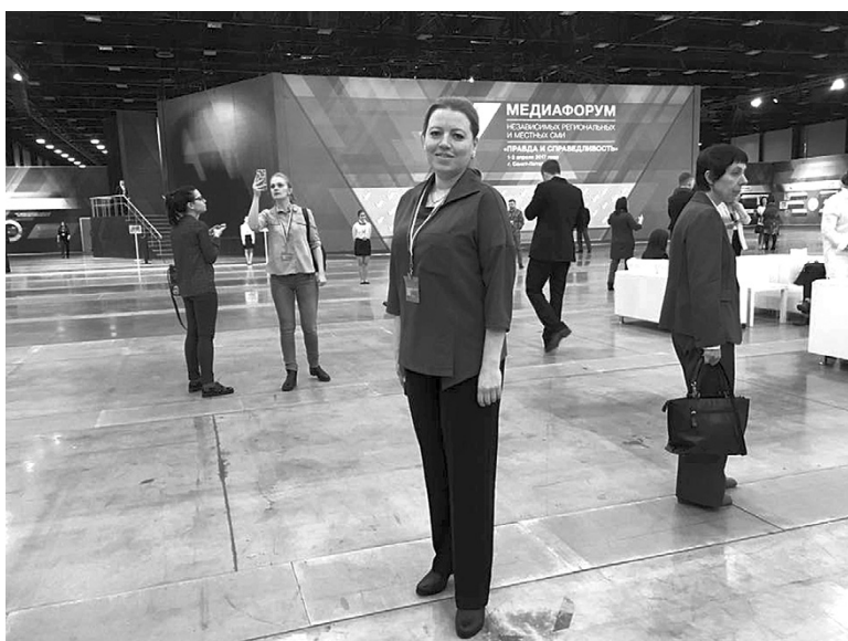
Корреспондент «Байкальских зорь» на Медиафоруме ОНФ

ласти. Я журналист газеты «Байкальские зори», Ольхонский район, то есть с берегов Байкала.