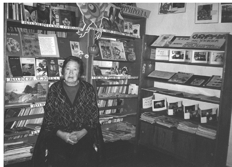
Библиотека – мой второй дом. 2014 г.

выборах на пост губернатора Иркутской области записать в наказ, чтобы сократили количество туристов на период засухи. Писала о том, что по вине туристов случаются пожары. Я признаю, что без туризма населению на острове не прожить. Основные градообразующие предприятия острова ММРЗ и совхоз «Ольхонский» «канули в лету». Постоянной работы в поселке совсем немного.