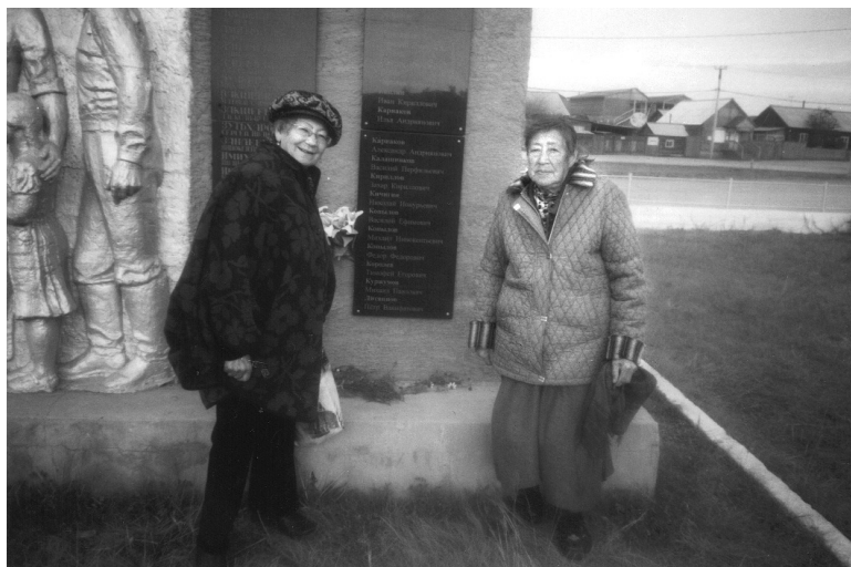
У мемориала «Павшим землякам на фронтах ВОВ». Май 2015 г.